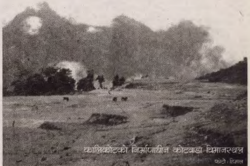
फाल्गुनकोटको निर्माणाधीन कोटवाडा विमानस्थल

जेनेभा महासन्धिले संघर्षमा संलग्न पक्षहरू र तिनका सशस्त्र सैनिकहरूको युद्धमा प्रयोग गर्ने तौर तरिका र साधन असीमित हुने छैन, अनावश्यक हानी-नोक्सानी पुर्‍याउने अथवा अत्यधिक पीडा दिने हातहतियार अथवा युद्धको तौरतरिका प्रयोग गर्न निषेध गरिएको छ भन्ने मान्यता लिएको छ। तर, हाम्रो देशको सन्दर्भमा हेर्ने हो भने संभव भएसम्मका सबै खाले तौरतरिकाहरू अपनाइएको छ। सुरक्षाकर्मीद्वारा हेलिकप्टरद्वारा अन्धाधुन्ध गोली प्रहार गर्दा पूजा गरिरहेका सर्वसाधारण नागरिकहरूको मृत्यु भएको घटना होस् वा माओवादीहरूले सुरक्षाकर्मीहरूमाथि रकेट लन्चर प्रहार गरेर क्षति पुर्‍याएको घटना, असीमित तौरतरिका र साधनको प्रयोग भएको पाइन्छ। एकातर्फ सुरक्षाकर्मीहरू आफ्ना विगतमा लुटिएका हतियारहरू फर्काउने र अझ अत्याधुनिक हतियार प्रयोग गर्ने अभियानमा लागेका छन् भने अर्कातर्फ माओवादीहरू पनि अझ घातक हतियारहरू कसरी भित्र्याउन सकिन्छ